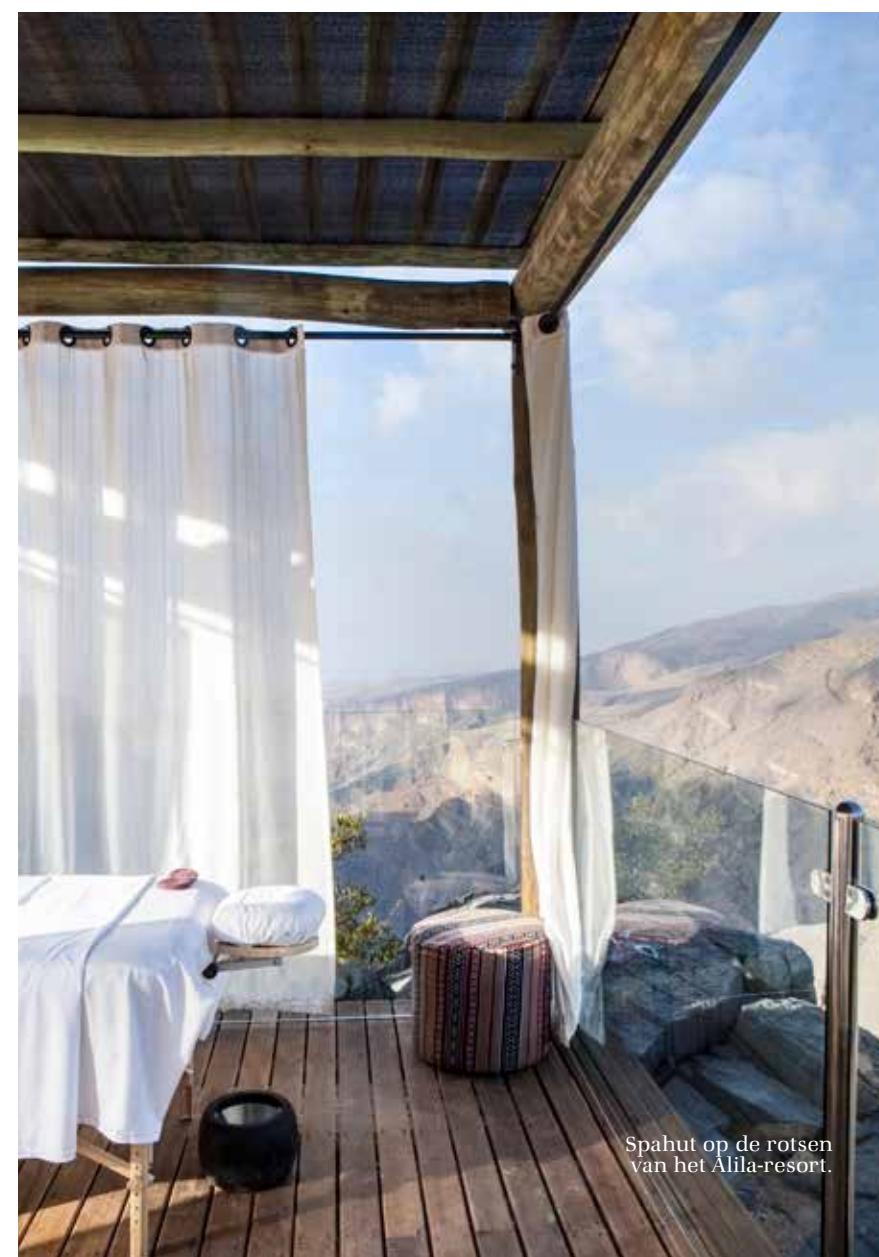
Spahut op de rotsen van het Alila-resort.

woestijn van veranderlijke zandduinen, in het zuiden. In het uiterste noorden ligt Musandam, een groene landtong. Zodra we Muscat uitrijden, zien we het landschap veranderen: palmen maken plaats voor kale rotsen. We maken een tussenstop bij het Bayt Ar Ridayah-kasteel. Het is een zeventiende-eeuws bolwerk nabij Nizwa. De stad ligt op het kruispunt van oude karavaanroutes en is befaamd om zijn geitenmarkt. Ook hier nemen we een kijkje. Het is er een en al gekrioel van mensen en dieren. Mannen trekken onwillige geiten mee aan een touw en er wordt druk onderhandeld. Er zijn zwarte en witte geiten en langharige. De langharige komen uit Oman zelf en zijn het meest kostbaar. Als het slachtfeest nadert, schieten de prijzen omhoog. Via Nizwa bereiken we het Hadjargebergte, waar we op een politiepost stuiten. Een agent vraagt op barse toon naar de autopapieren. Zodra hij merkt dat we buitenlanders zijn, glimlacht hij: "Welkom." We zetten de auto in 4WD, want off-road is dat in Oman verplicht. De weg blijft echter onverminderd goed geasfalteerd, al zijn er veel bochten en hellingen. Het is fijn doorrijden, al hadden we stiekem gehoopt op een écht off-road avontuur.