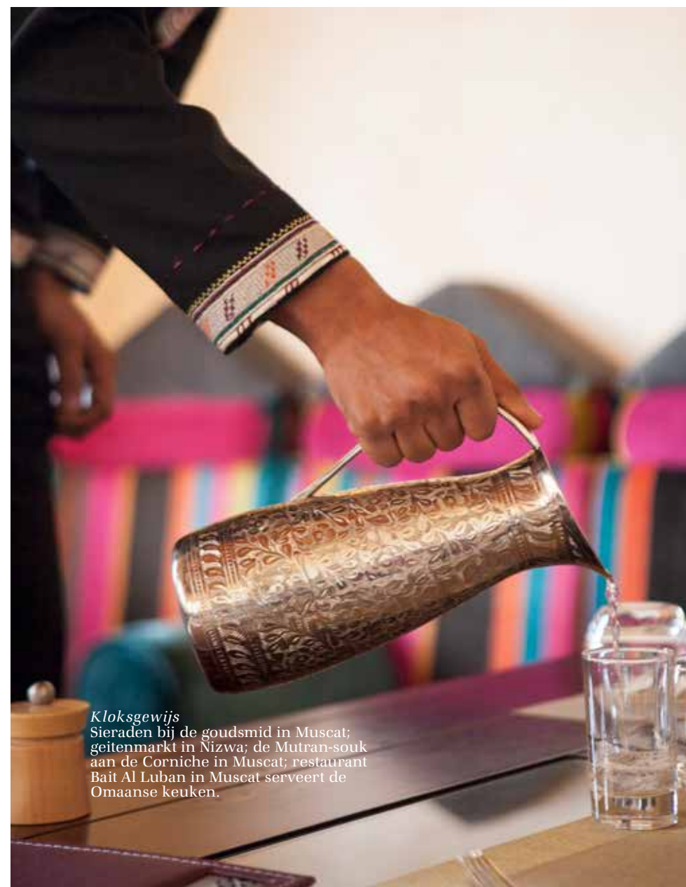
Kloksgewijs Sieraden bij de goudsmid in Muscat; geitenmarkt in Nizwa; de Mutran-souk aan de Corniche in Muscat; restaurant Bait Al Luban in Muscat serveert de Omaanse keuken.