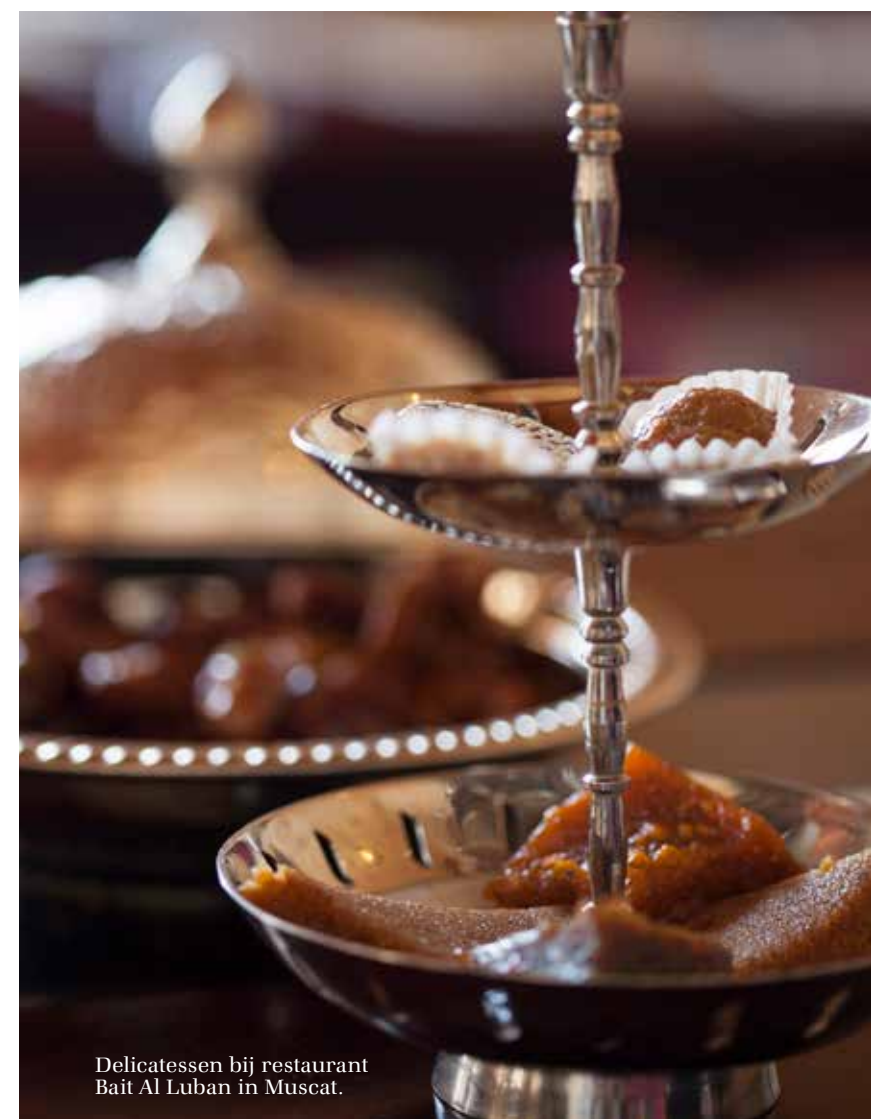
Delicatessen bij restaurant Bait Al Luban in Muscat.

ook al niet te versmaden. Het blijft één lofzang: de suites zijn heerlijk met crispy linnen beddengoed, een badkamer met fraaie badkuip en fijne verzorgingsproducten van het eigen label Alila. De balkons kijken uit op de imposante sterrenhemel. We zitten hier zó afgelegen dat er van lichtvervuiling geen sprake is.