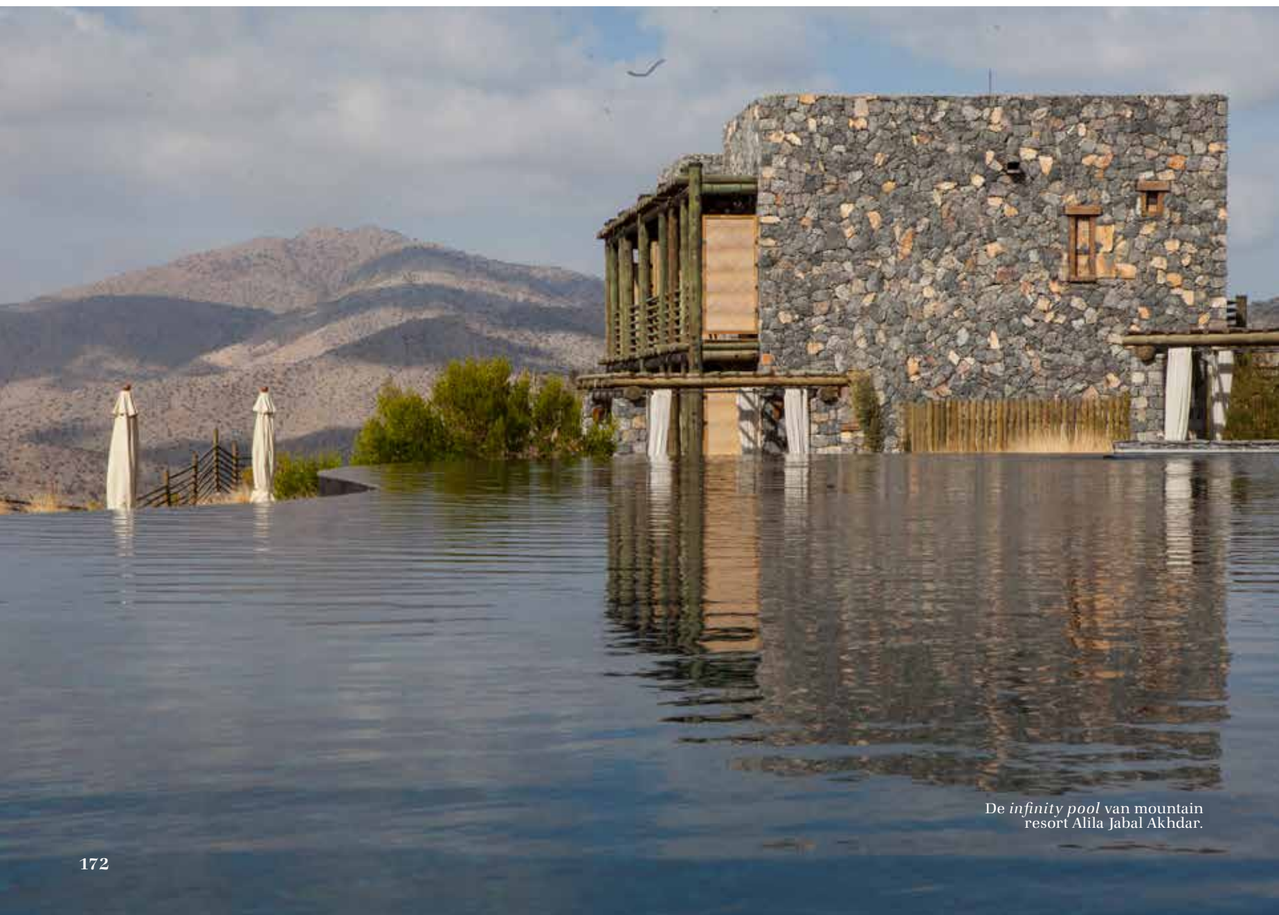
De infinity pool van mountain resort Alila Jabal Akhdar.