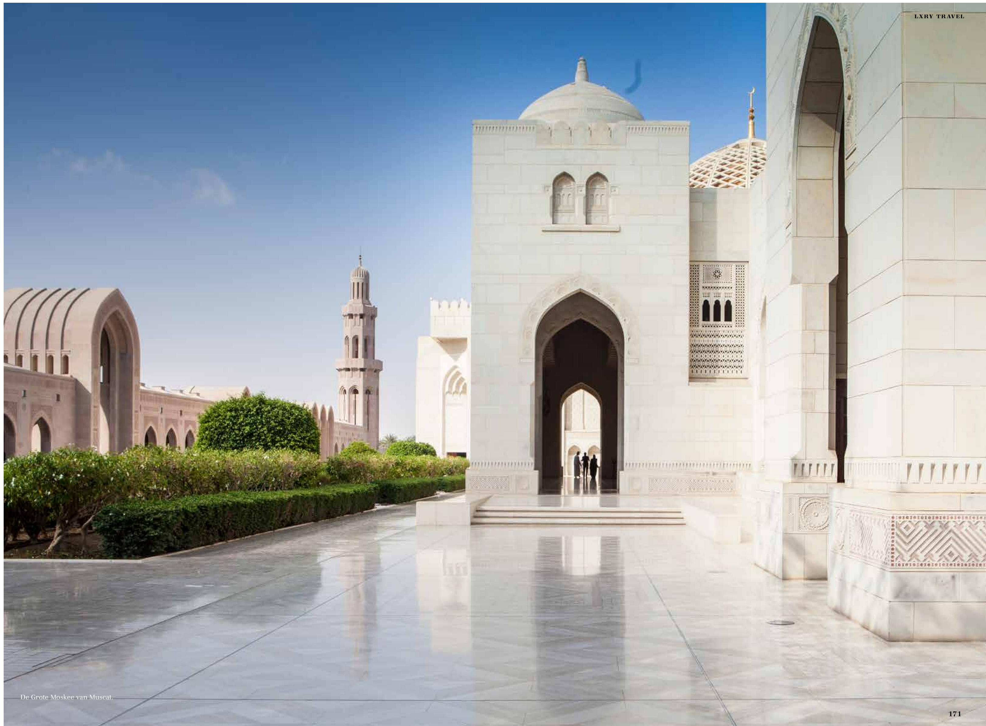
De Grote Moskee van Muscat.