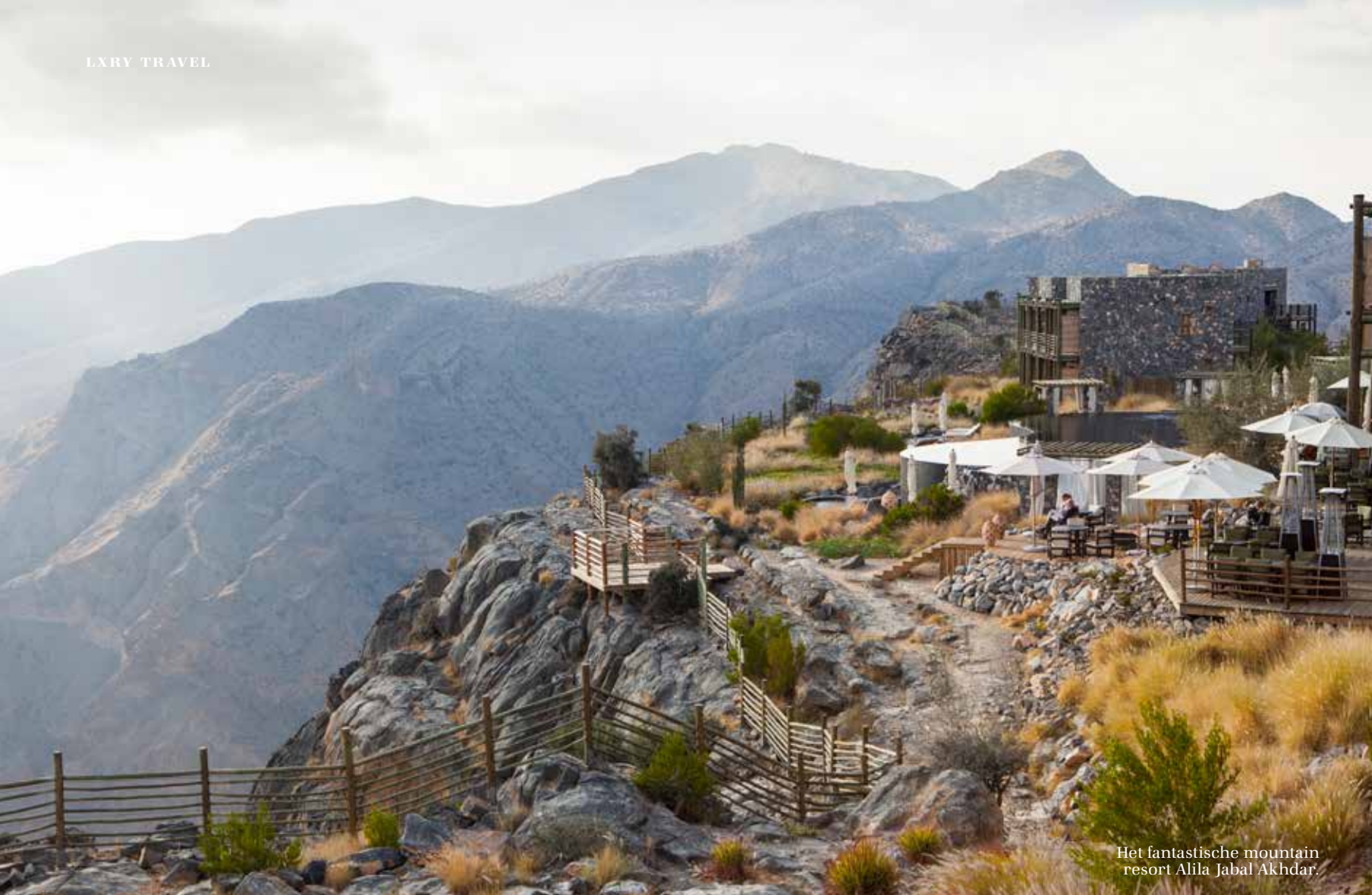
Het fantastische mountain resort Alila Jabal Akhdar.