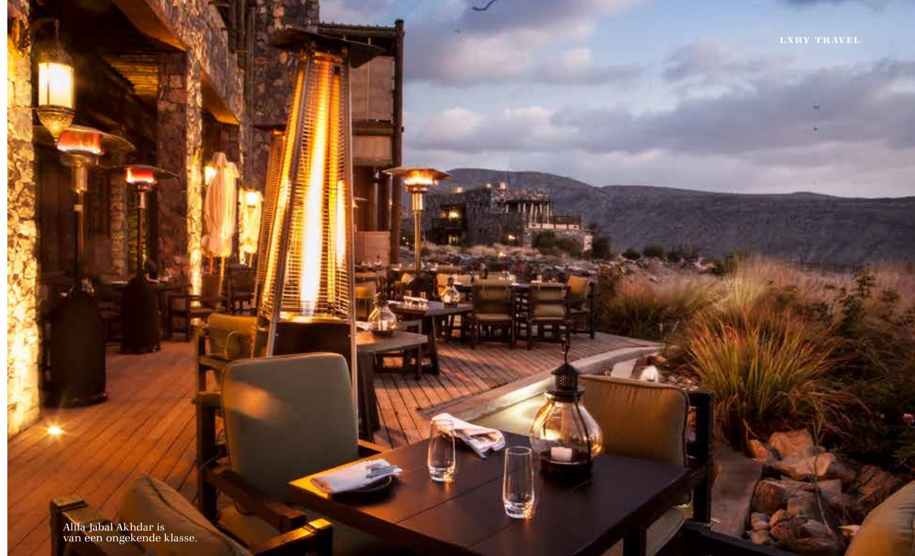
Alila Jabal Akhdar is van een ongekeerde klasse.

We nemen afscheid van The Chedi en gaan op weg naar de bergen. Ik kruip achter het stuur van de Toyota Land Cruiser en rijd over goed geasfalteerde snelwegen. De huurauto is een bakbeest, maar rijdt geweldig soepel. Het voelt stoer om door het bijna onaardse landschap te cruisen. Oman bestaat uit diverse regio's: de groene gebieden rond Muscat, de kust met zandstranden, woeste bergen, de centraal gelegen Wahiba-woestijn en het Lege Kwartier, een